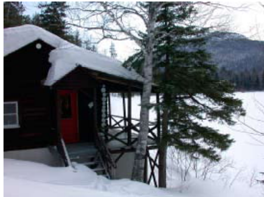
Chalet du lac (rustique)