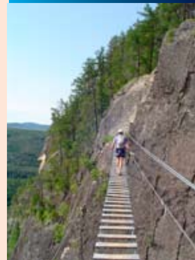
Pont suspendu (Via-Ferrata)