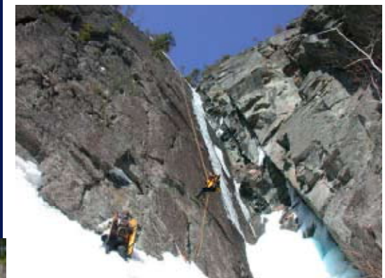
Rappel de la Via-Ferrata